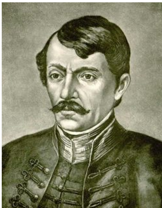
Slika 1. Dr Jovan Stejić

Jovan Stejić (1803, Arad, Rumunija - Beograd, 5. decembar 1853, slika br.1), je bio istaknuti srpski lekar i književnik [1], koji je u uslovima prve polovine XIX veka u kojima je radio, pilotirao na više polja medicinske nauke i tako bio ispred svog vremena, a takođe dao veliki doprinos i srpskom jeziku.